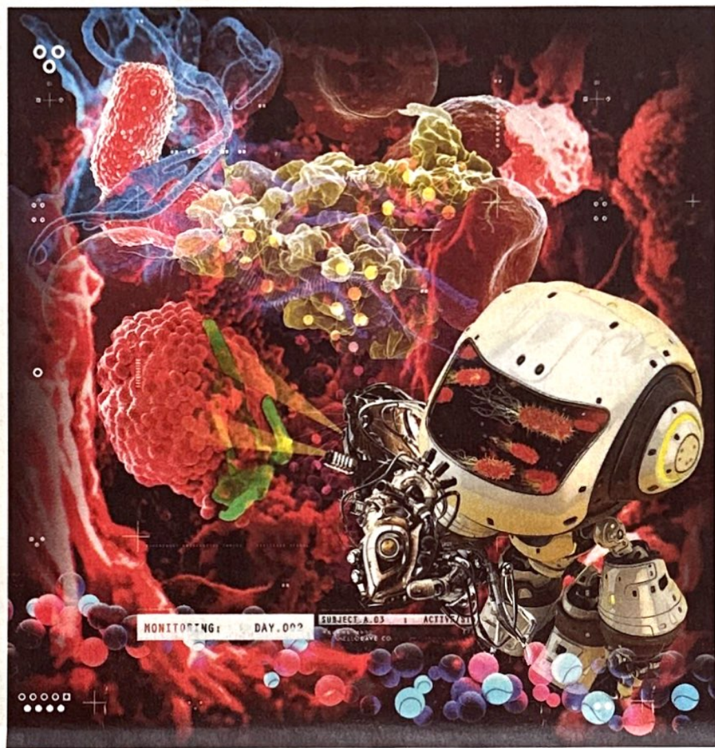
Illustration: Faith Ayedogba

Heitzinger ist zwar kein Mediziner, befasst sich als Mathematiker aber mit Blutvergiftungen und deren Merkmalen. Er ist Co-Direktor des Center for Artificial Intelligence and Machine Learning (CAIML) und leitet die Forschungsgruppe „Maschinelles Lernen und Unsicherheitsquantifizierung“ an der Technischen Universität Wien. Mit einem Team aus Diplomandinnen